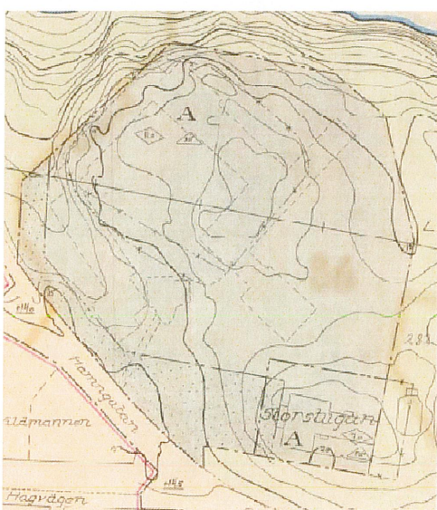
Gällande detaljplan nr 36 från 29 juni 1950.

Upplysningar Ändring av detaljplan upprättas enligt plan- och bygglagen 2010:900 och handläggs med förenklat ändringsförfarande.