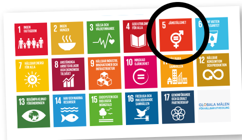
Agenda 2030: Globala mål antagna av FN 2016 som alla nationer som undertecknat dokumentet ska arbeta utefter nationellt och lokalt.