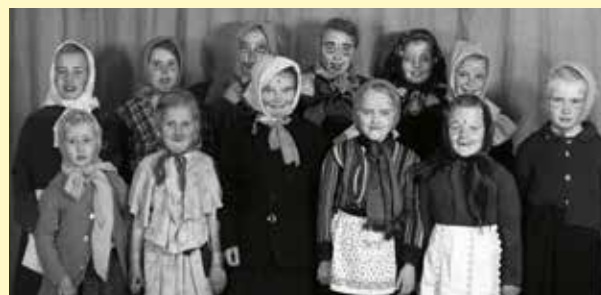
Påskkärringar på Rindö 1943.

Det går bra att mejla till joan.silverfred@vaxholm.se eller skicka med post till: Stadsarkivet, 185 83, Vaxholm. Var noga med att ange namn, adress och telefon om du vill ha bidragen i retur.