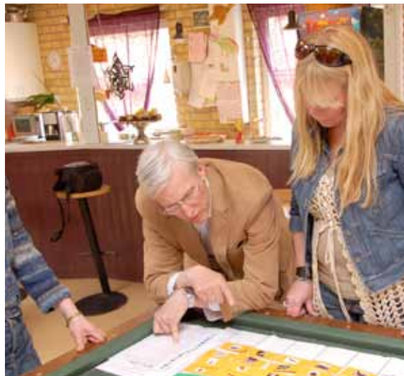
Här klurar man på knepiga matematikproblem.