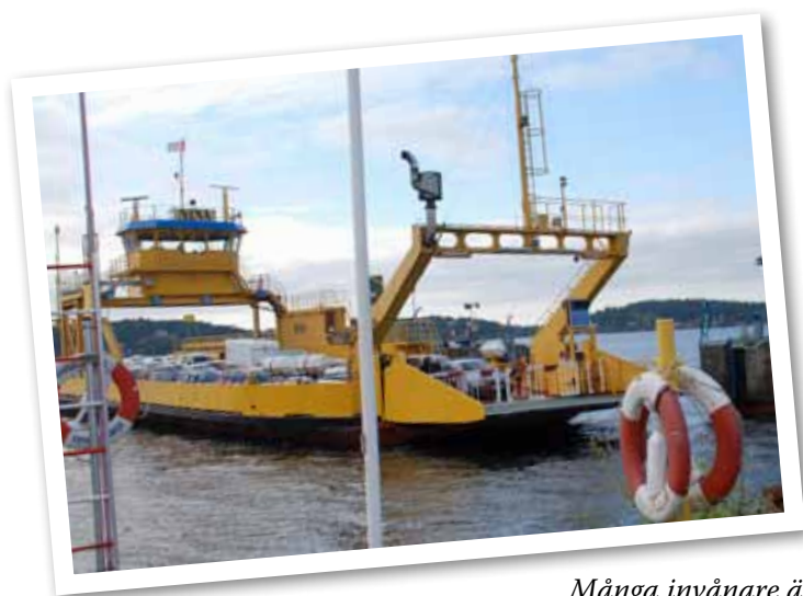
Många invånare är beroende av Rindöfärjan.