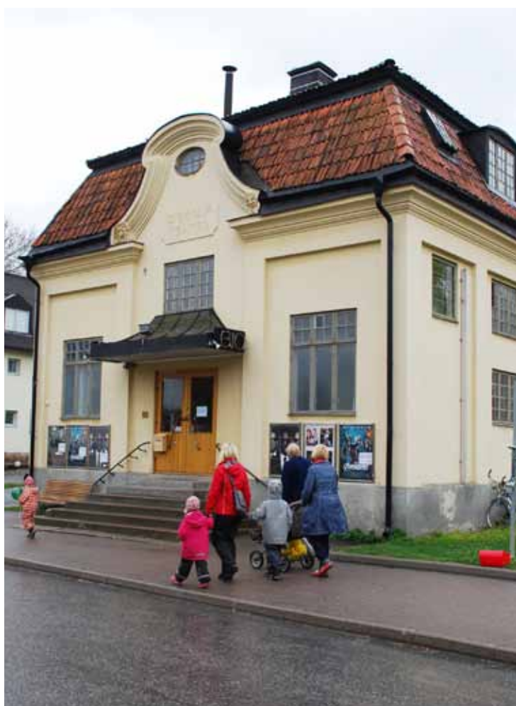
Platserna på Vaxholms biografteater har stundtals varit utsålda.