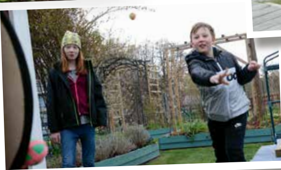
Barnbarn på besök för en stunds lek på en av tomterna.

många, men även kolonister åldras. Att inte längre kunna sköta sin lott kan också skapa sorg och känslor av förlust. Ändå pågår här något av ett generationsskifte just nu. Yngre kommer in med ny kraft och lär sig av äldre medlemmar med gedigen kunskap.