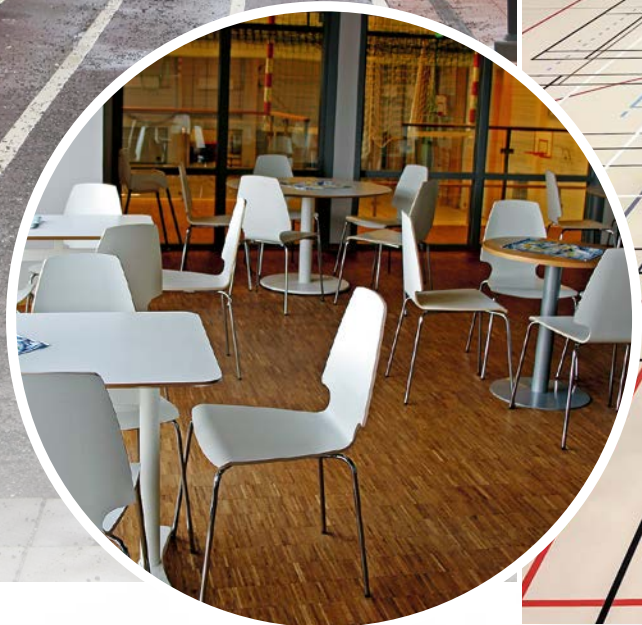
Café Mellanmål har öppet 16–20 på vardagar och 9–18 på helger. Tiderna kan variera efter behov vid matchdagar.