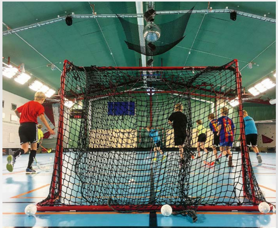
Vaxholms innebandyförening har drygt 20 lag igång under en vecka. Matcherna spelas på helgerna och det totala medlemstalet är en bit över 500. (Läs mer om Vaxholms innebandyförening bland insända notiser från föreningarna på sidan 22.)

Förhoppningen är att bland annat de föräldrar som hämtar och lämnar barn på området ska se möjligheter i att utnyttja väntetiden genom att själva träna på gymmet, som kommer erbjuda en bra utsikt över fotbollsplanen.