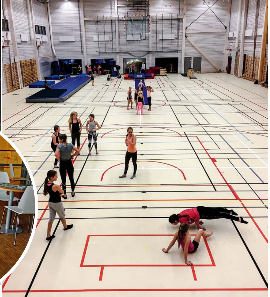
Waxholms gymnastikförening är en av föreningarna som har fasta tider i Sporthallen. Föreningen är öppen för alla och merparten aktiva är barn och unga, från tre år och uppåt. Barngymnastik och parkour för de yngsta (upp till sju år), parkour och trupp gymnastik för de äldre. Trupp gymnastik attraherar många i Vaxholm. Sportens populariteten i landet har knappast minskat av de två gulden Sverige nyligen tog i EM. I Vaxholm har man under de senaste åren gått från två till tio truppgrupper, samt ett flera barn- och parkour-grupper.