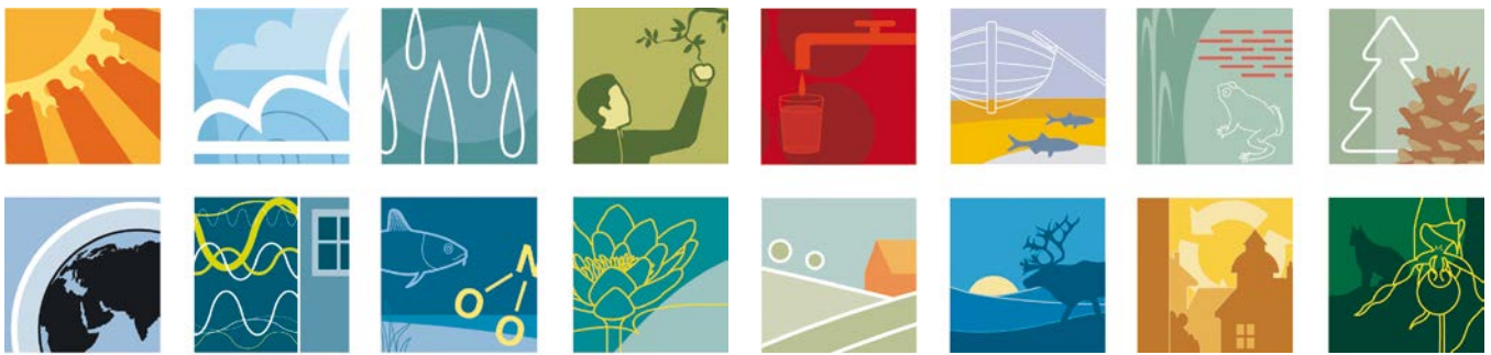
SVERIGES 16 MILJÖKVALITETSMÅL. ILLUSTRATÖR: TOBIAS FLYGAR