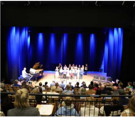
Kulturskolan höll välbesökt konsert i Kronängsskolans aula.