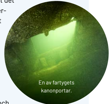
En av fartygets kanonportar.

Historia. I slutet av oktober avslöjades att det verkligen var örlogsskeppet Vasas systerfartyg Äpplet som 2020 hittades i vattnet nära Vaxholm. Nyheten kablades ut i många hundra medier världen över, förutom i våra grannländer och i hela EU också bland annat USA, Kanada, Latinamerika och i flera asiatiska länder. Nyheten blev extra stor eftersom det är mycket ovanligt att så gamla träfartyg hittas i så gott skick. Det bräckta och kalla Östersjövattnet skyddar vraken mot skeppsmask som annars snabbt äter upp gamla båtskrov under vatten.