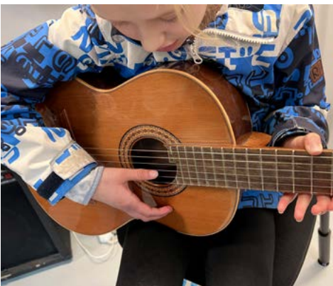
Många barn provade på att spela olika instrument i kulturskolan.

Den som var hungrig på mer än kultur kunde besöka Kronängsskolans skolrestaurang som för dagen hade öppnat sin stora buffé för allmänheten.