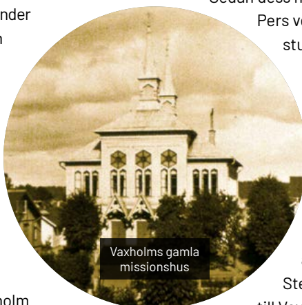
Vaxholms gamla missionshus