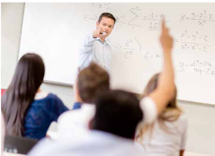
Det är viktigt att hörselskadade elever får samma möjlighet till delaktighet som sina fullt hörande kamrater.

Med hjälp av det beviljade medlet och kommunens egna satsningar, kommer Vaxholms stad i slutet av 2015 att kunna uppnå minst ett akustiksanerat klassrum på varje skola. Det kommer att finnas akustiksanerade förskoleklassrum, som anpassats för barn med hörselskada och ljuddämpade matsalar och trapphus.