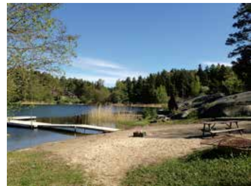
Tynningö ska utvecklas samtidigt som värden som finns i dag ska bevaras.

granskningskedet där åsikter och synpunkter från berörda parter och remissinstanser ska tillvaratas och beaktas för att möjliggöra förbättringar av planen. Granskningskedet förväntas ske till hösten 2015.