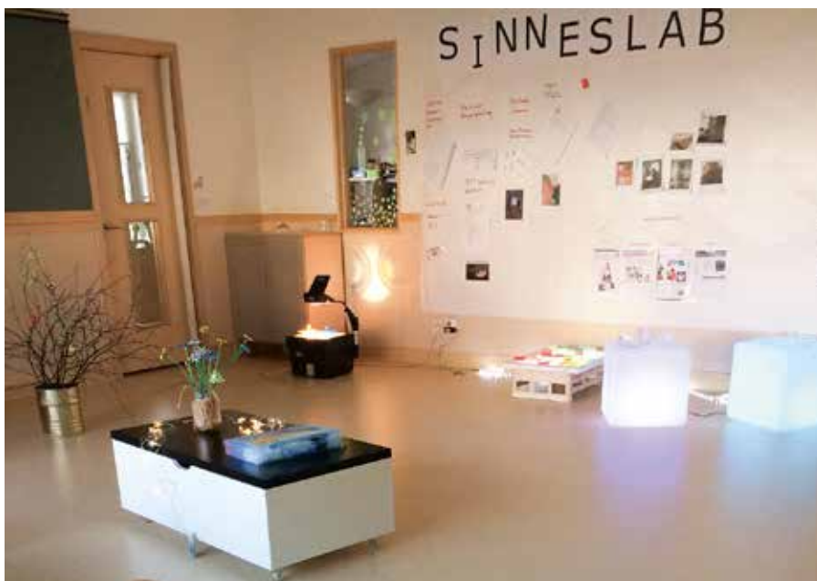
Att bygga ett Sinneslabb är en process. Rummet har erövrats bit för bit.