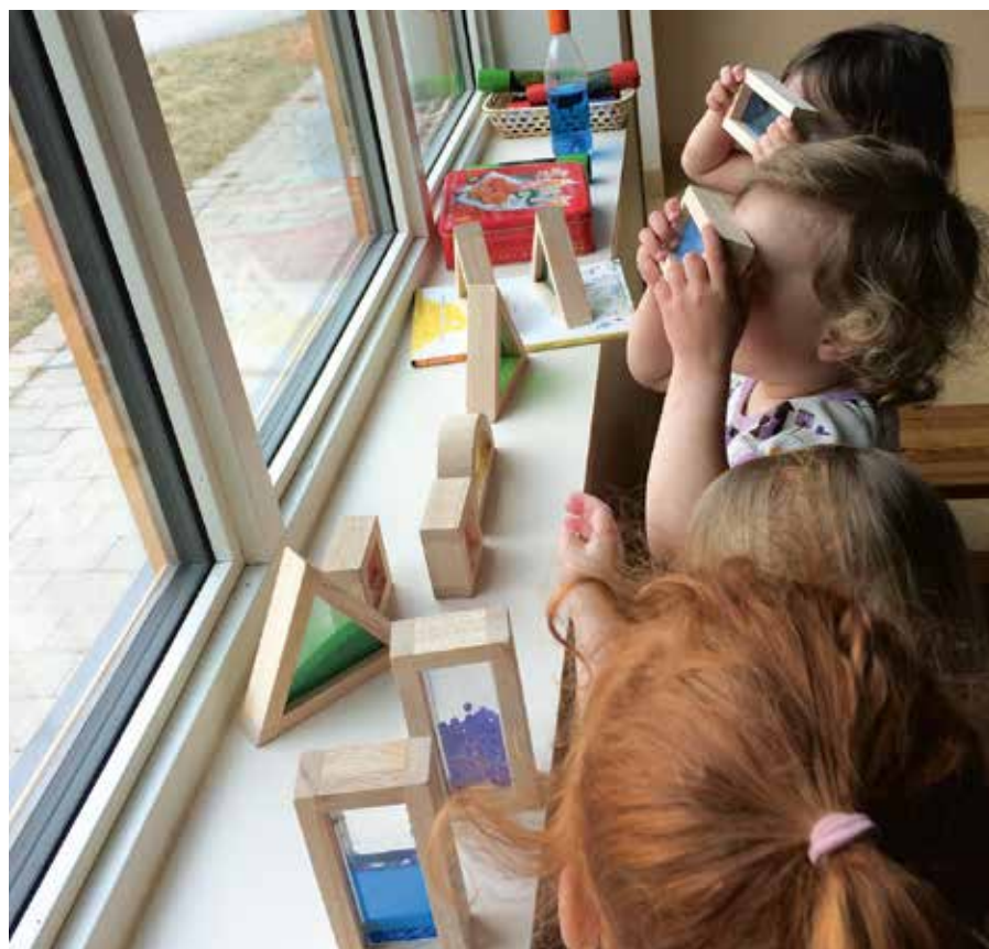
Lärandet ska vara lustfyllt och byggas utifrån barnens egna sinnesintryck.

TEXT OCH FOTO: EVA TUVHAV GULLBERG, FÖRSKOLLÄRARE OCH ATELJERISTA PÅ FÖRSKOLAN