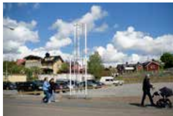
Shelltomten ligger mellan färjeläget och Hamnkrogen.

Tidsramen för gågatan är den 15 juni till den 1 september. Beslutet togs av Nämnden för teknik, fritid och kultur.