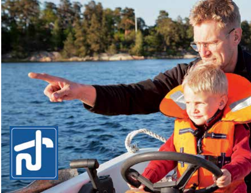
Symbol för toatömningsstation.