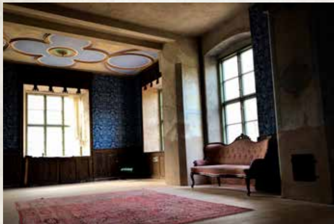
Det pågår en varsam restaurering. I slottets matsal rasade taket in på 1900-talet. Ett nytt golv har lagts in och tapeten är en handgjord kopia av originaltapeten från 1800-talet som på tidstypiskt vis sytts fast för hand och limmats ihop med kaninblod.