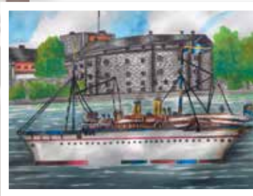
Ångbåten Drott, 1800-tal.