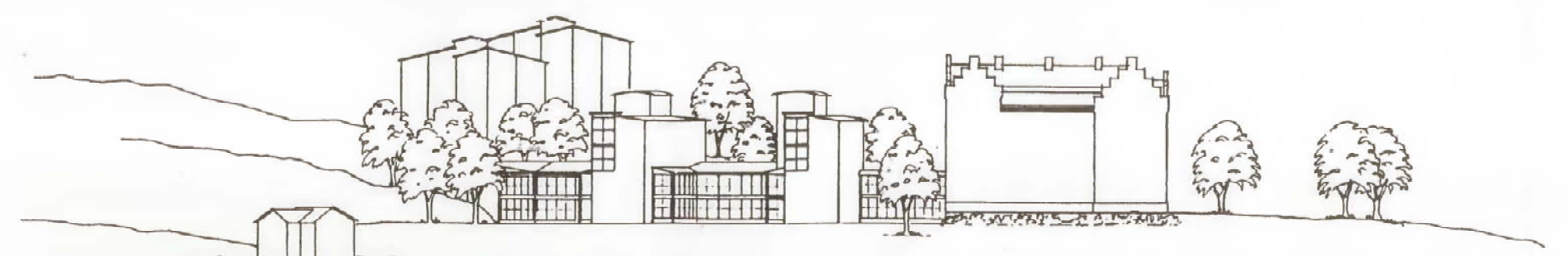
VY FRÅN VATTNET