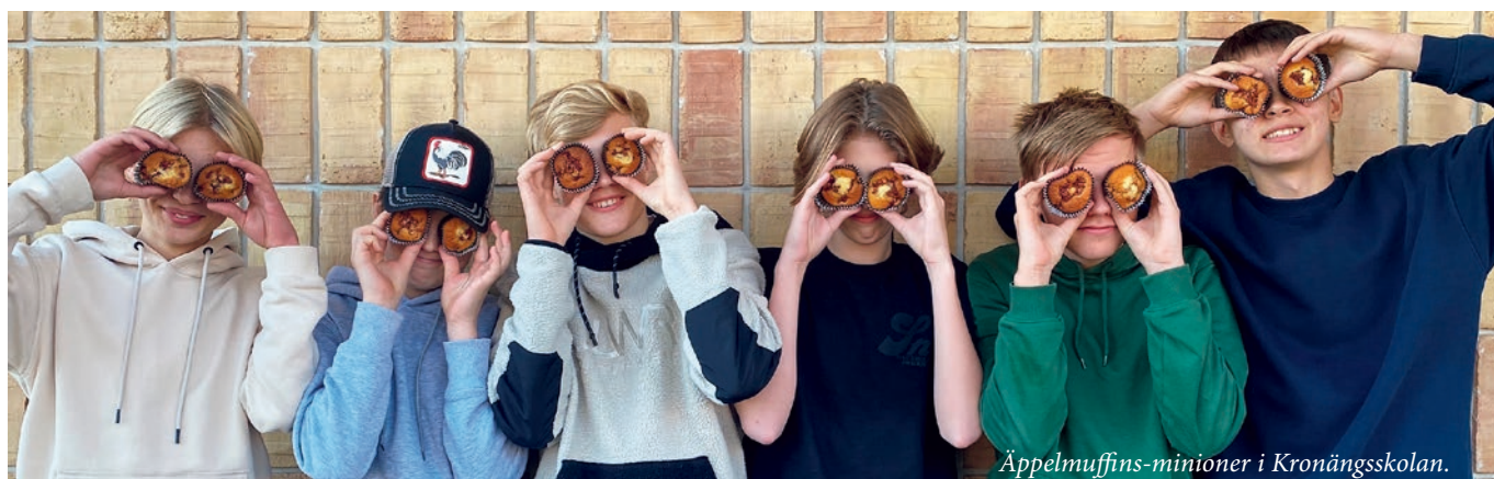
Äppelmuffins-minioner i Kronängsskolan.