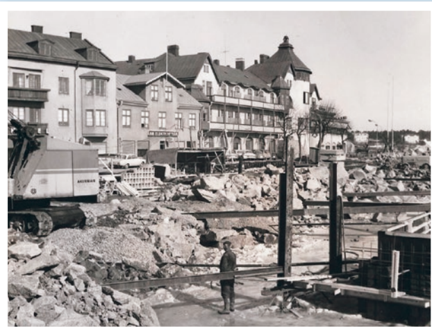
År 1968 påbörjades utfyllnaden av Söderhamnen. Ångbåtsbryggan, T-bryggan samt taxibåtsbryggorna togs bort.