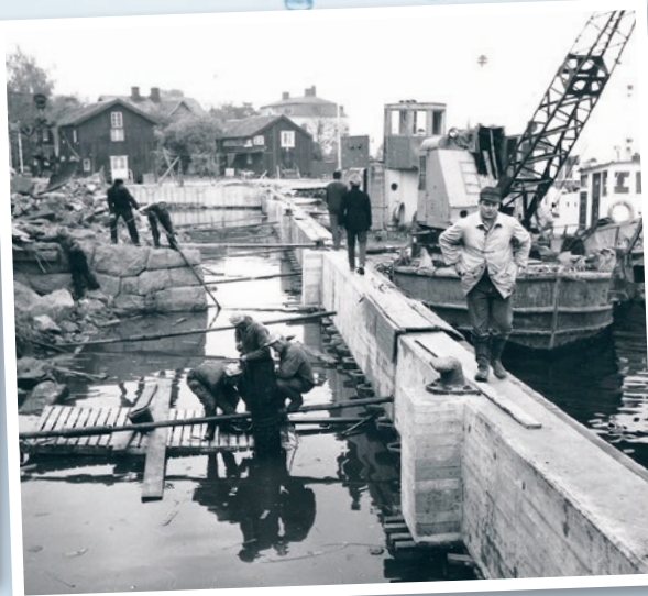
Arbetet med den nya kajen vid Österhamnen pågår oktober 1965. Resterna av steningen till den gamla nedgången framför tullhuset syns mitt i bilden.