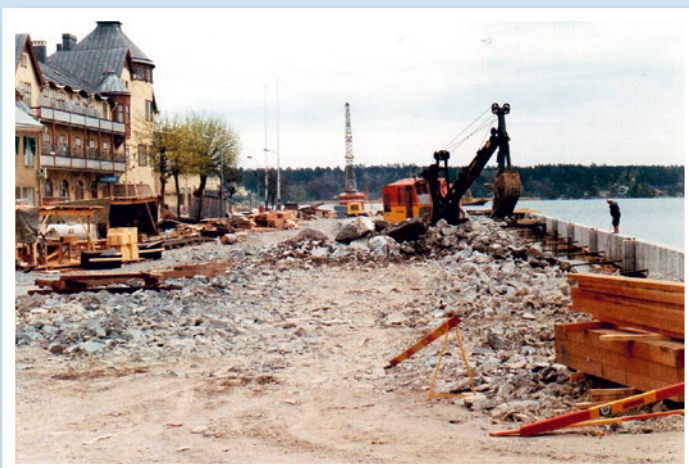
Våren 1969 hade området över ångbåtsbryggan och T-bryggan fyllts ut.

Kajen 1860. Spången från Strandgatan mot Cronhamnsplan. Till vänster kronans magasinsbyggnad. Till höger det vita tullhuset. I och med 1880-års stadsplan fylldes området igen.