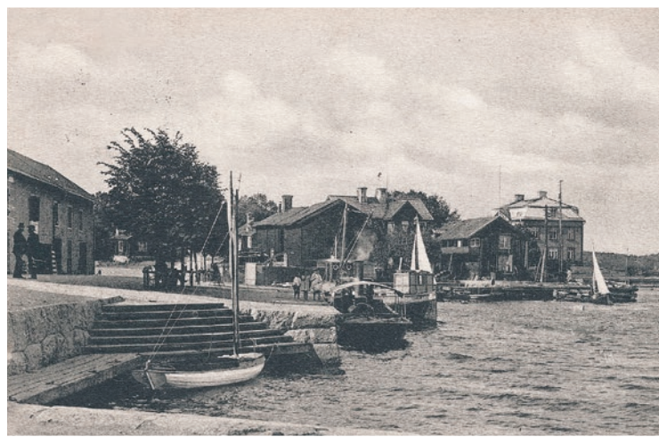
Kajen 1909. Magasinsbyggnaden längst till vänster revs 1981. Nybyggnationen, idag BRF Kronan, klar 1982. Nedgången i kajen framför tullhuset ändrades vid utfyllnaden år 1887 och flyttades något norrut. FOTO: 1909 FRÅN VAXHOLMS HEMBYGDSFÖRENINGIS BILDARKIV