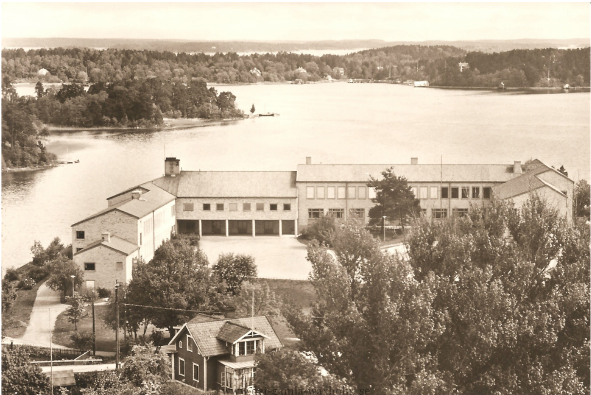
Norrbergsskolan sedd från vattentornet. På bilden syns tydligt hur området möter sekelskiftets trähusbebyggelse mot söder.