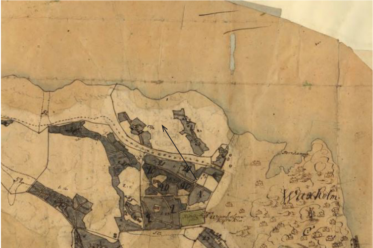
Detalj av karta från 1749. Mörkmarkerade ytor betecknar odlingsmark.