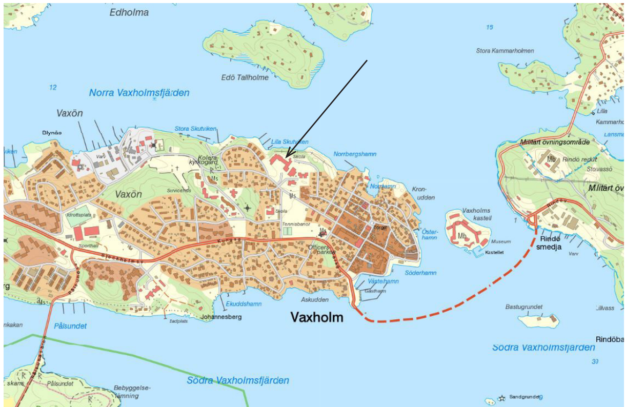
Vaxholm med objektets läge vid pilen.