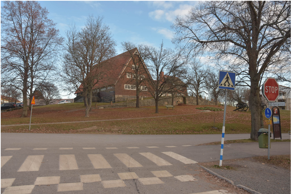
Storstugan, uppfört som soldathem 1907. Huset användes ursprungligen som samlingslokal och för sociala aktiviteter för militären, idag är det fritidsgård.