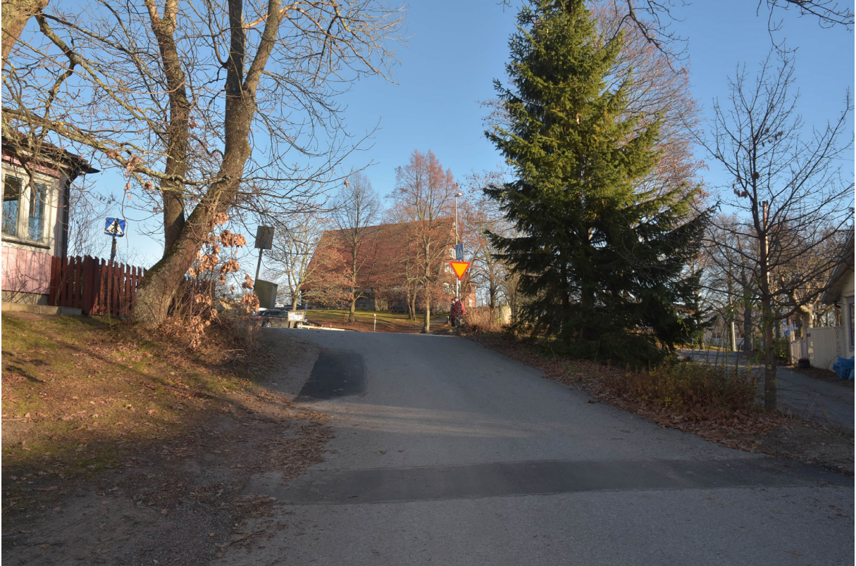
Vy från Kvarteret Terra Nova mot Storstugan. Gatunätet är troligen utlagt med detta fondmotiv i åtanke.