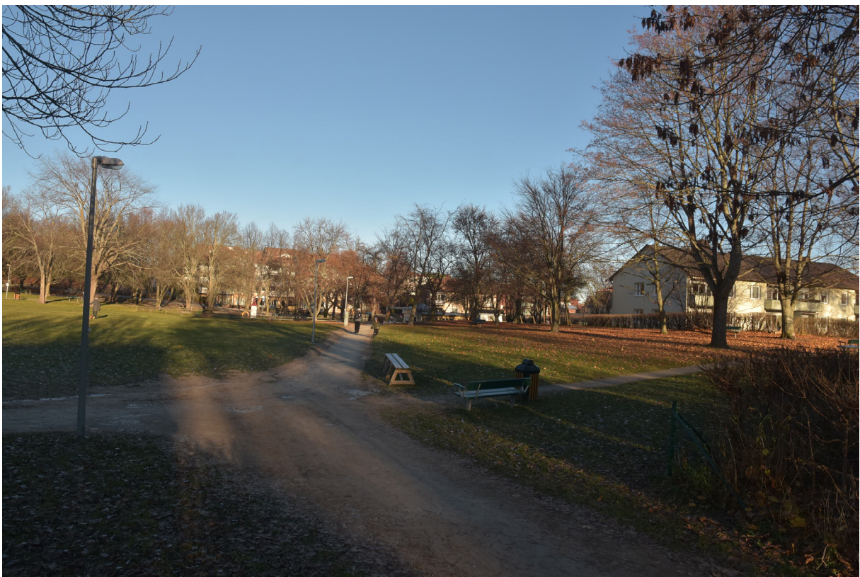
Vy över Lägret, det tidigare exercisfältet. I den södra delen låg tidigare militärbyggnader på rad längs med gatan.