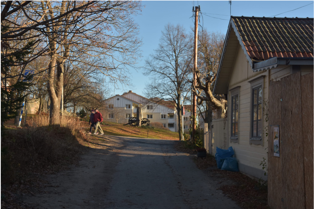
Kvarteret Terra Nova med det sena 1980-talets flerbostadsbus i Kvarteret Kasinot i fonden.