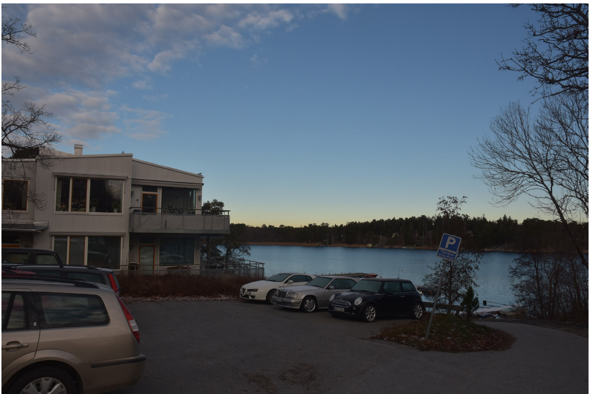
Kvarteret Skutviken med låg flerbostadsbebyggelse i souterräng. Byggt på 2000-talet.