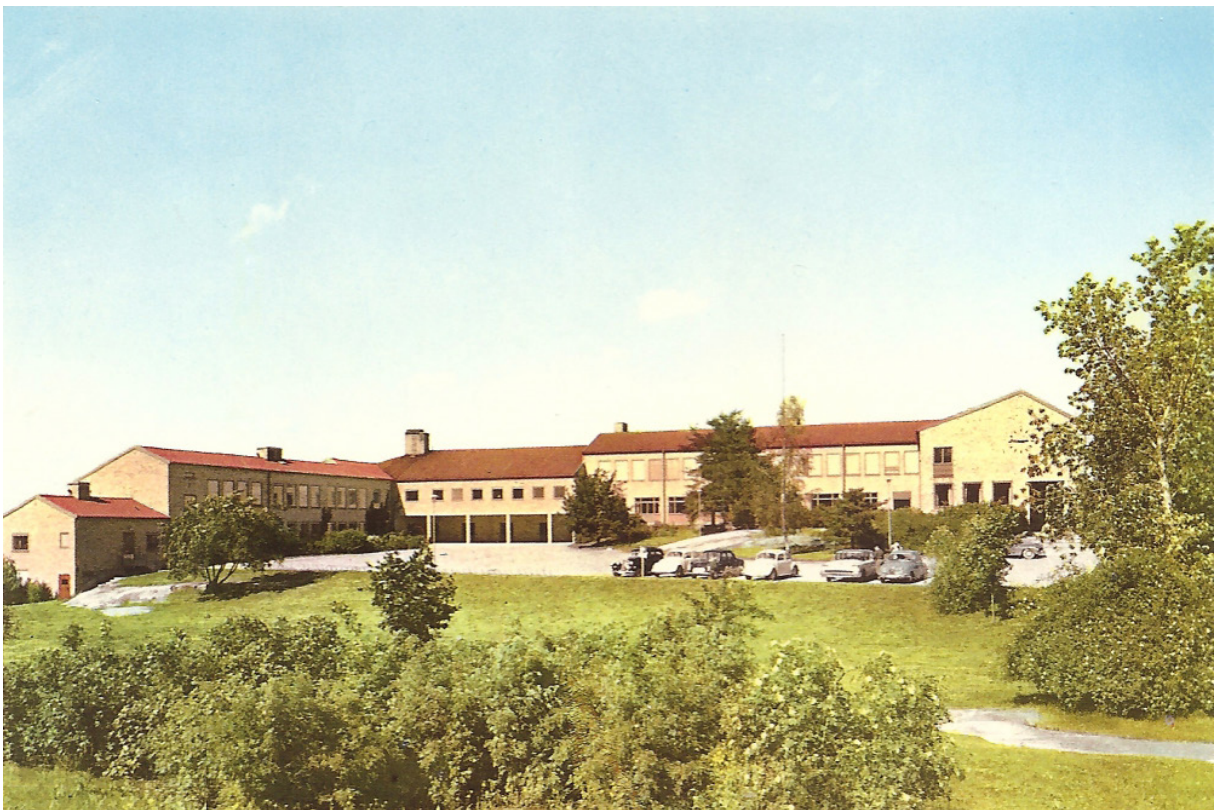
Norrbergsskolan från sydöst. Vid planeringen av skolan behölls ett stort respektavstånd och ett grönområde ner mot Storstugan, detta har senare bebyggts med barnstugor.