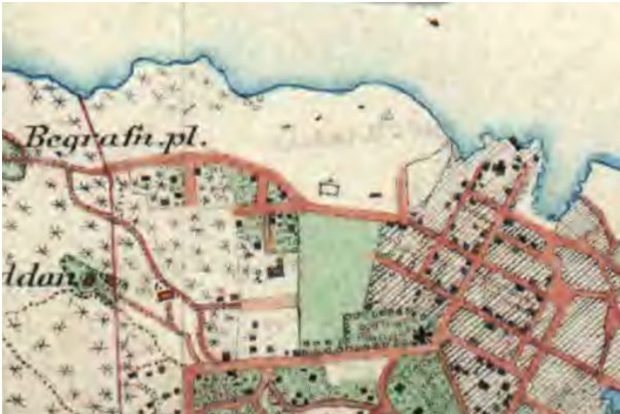
Detalj av häradsekonomska kartan från 1906. På denna karta ser man hur det nuvarande bebyggelsemönstret i Kvarteret Terra Nova väster om lägret växer fram. Från denna tid ingår även området öster om detta i stadsstrukturen. Storstugan är dock en solitär belägen i ett naturlandskap.