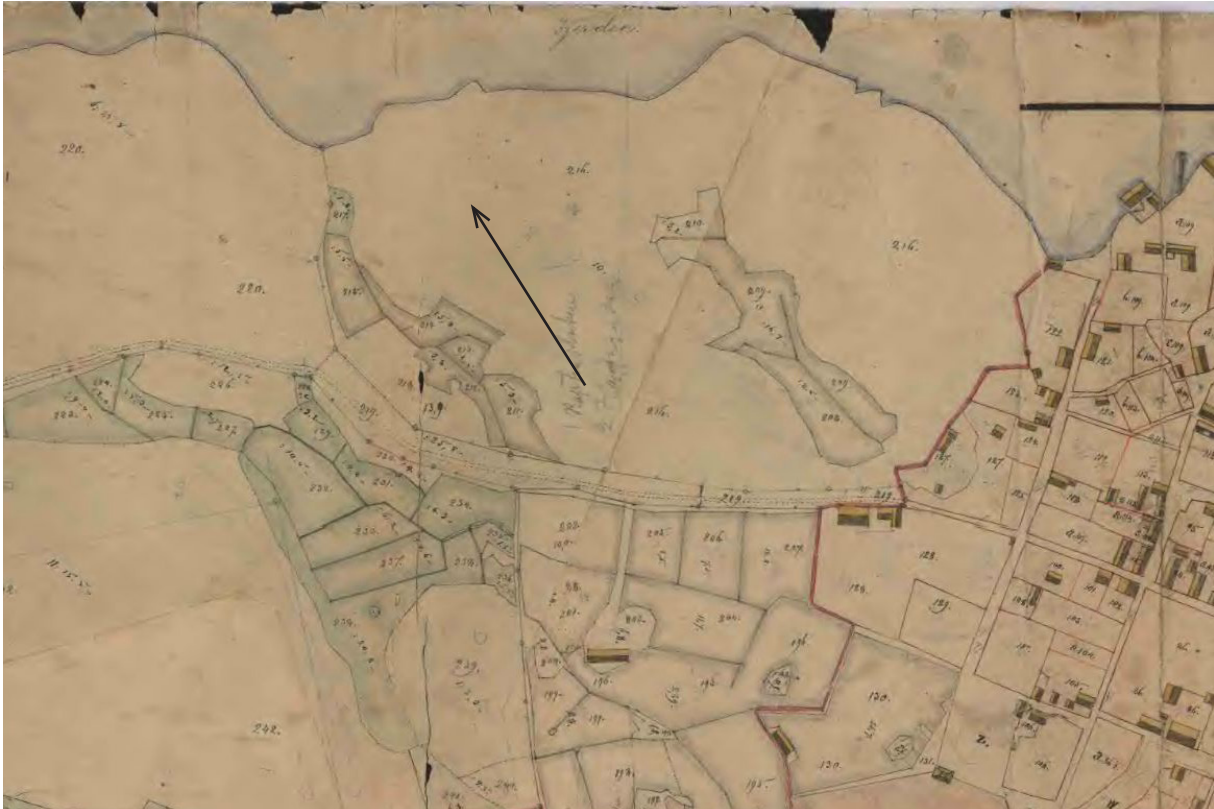
Detalj av häradsekonomska kartan från 1847.