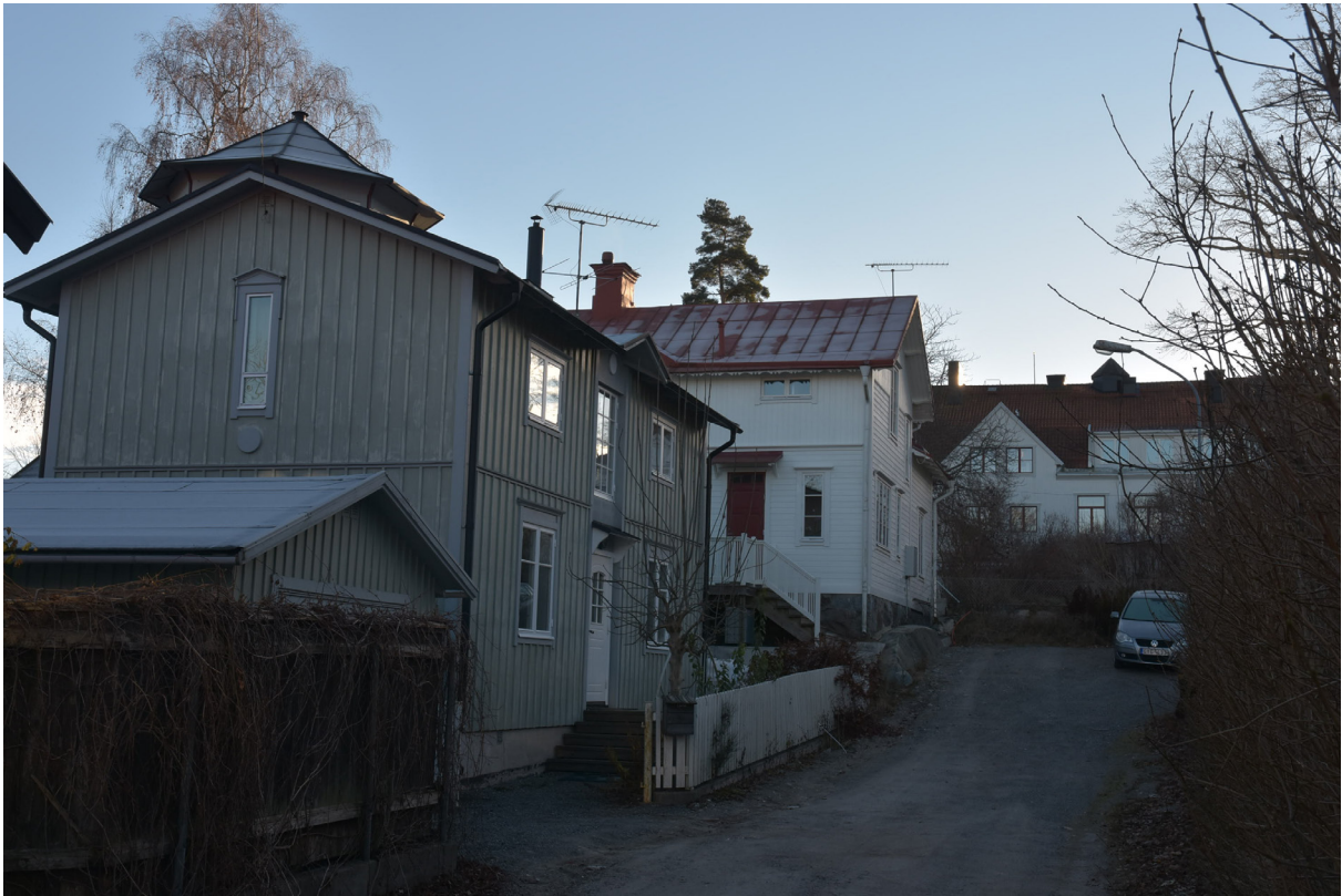
Del av småstadsbebyggelsen i Kvarteret Terra Nova. Denna är av olika ålder och stil men sekelskifteskaraktären dominerar.