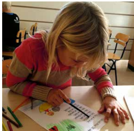
När texten skrivits klart ritar eleverna en bild och läser sin text högt för läraren.

– Vi strävar efter att alla ska uppleva att de lyckas. För oss är en god självbild och en god självkänsla den mest betydelsefulla och avgörande faktorn för den fortsatta läs- och skrivutvecklingen.