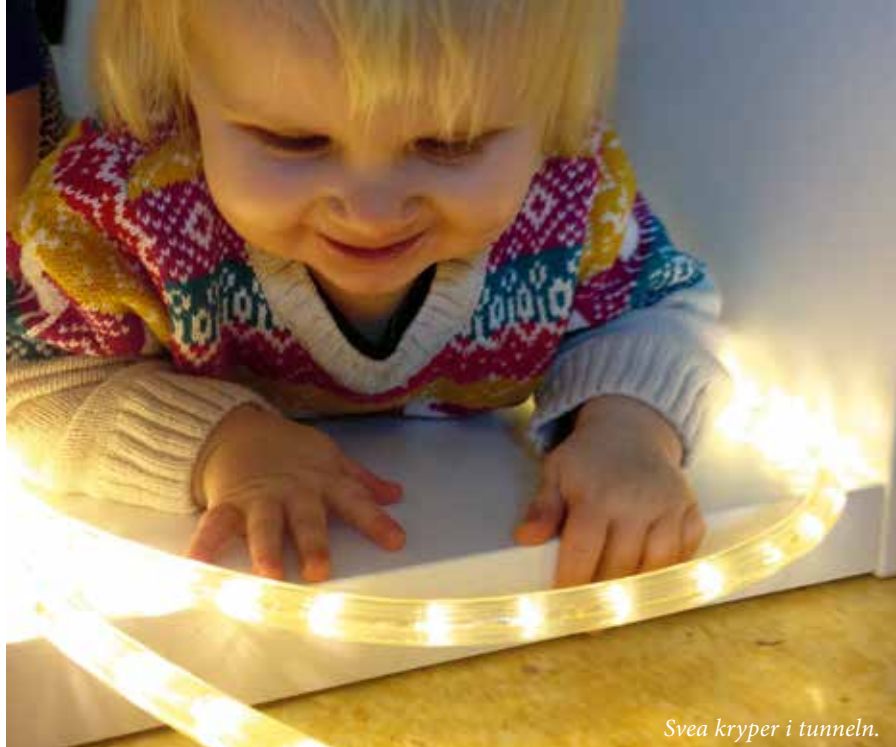
Svea kryper i tunneln.

TEXT: LENNART FRYKSKOG