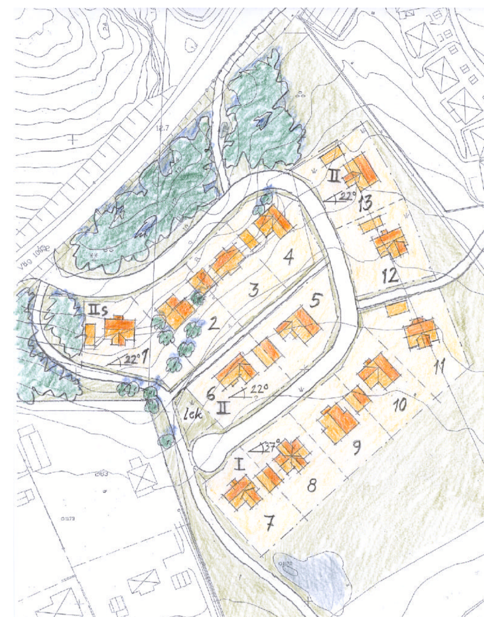
ILLUSTRATION ÖVER BOSTADSKVARTEREN Skala 1:1000 0 10 20 30 40 50 100 m