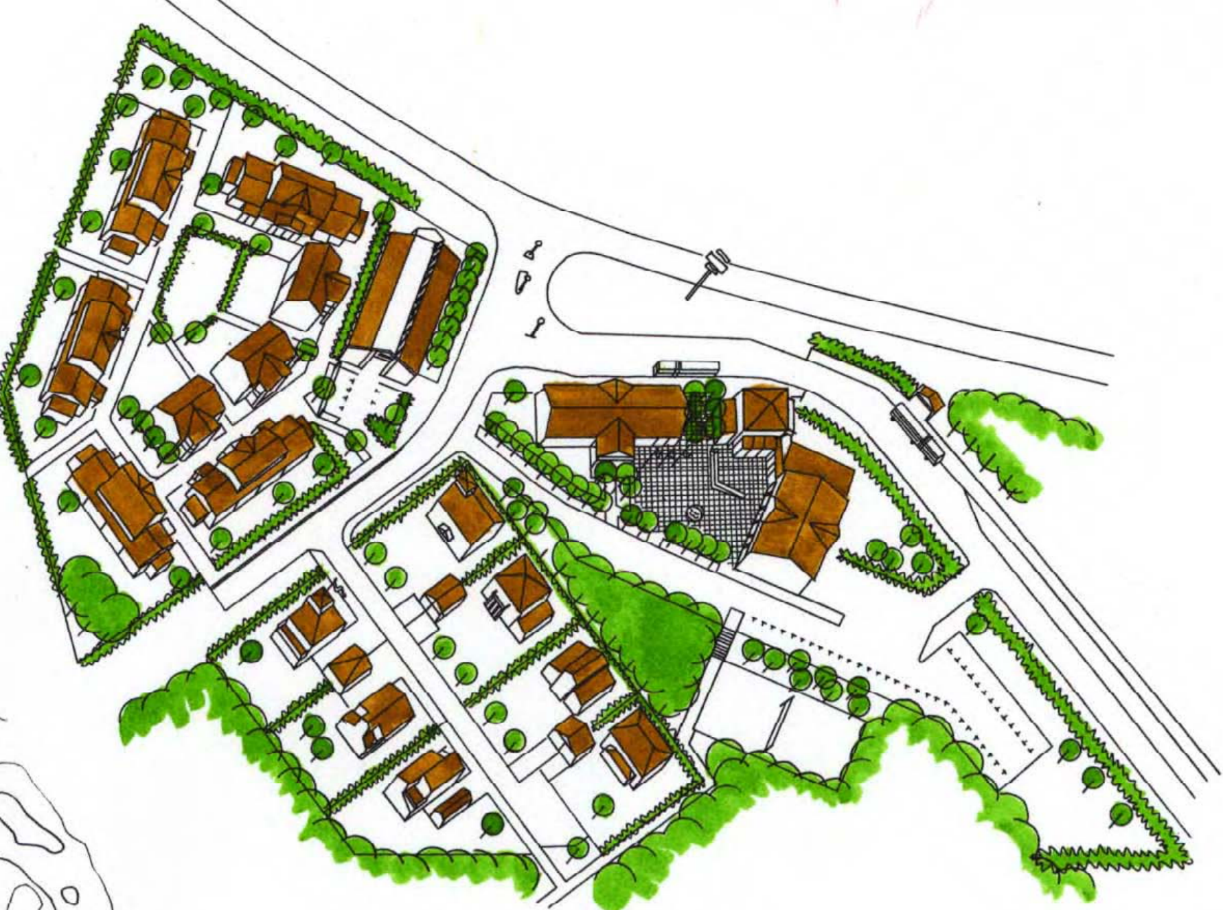
ILLUSTRATION - FÅGELPERSPEKTIV