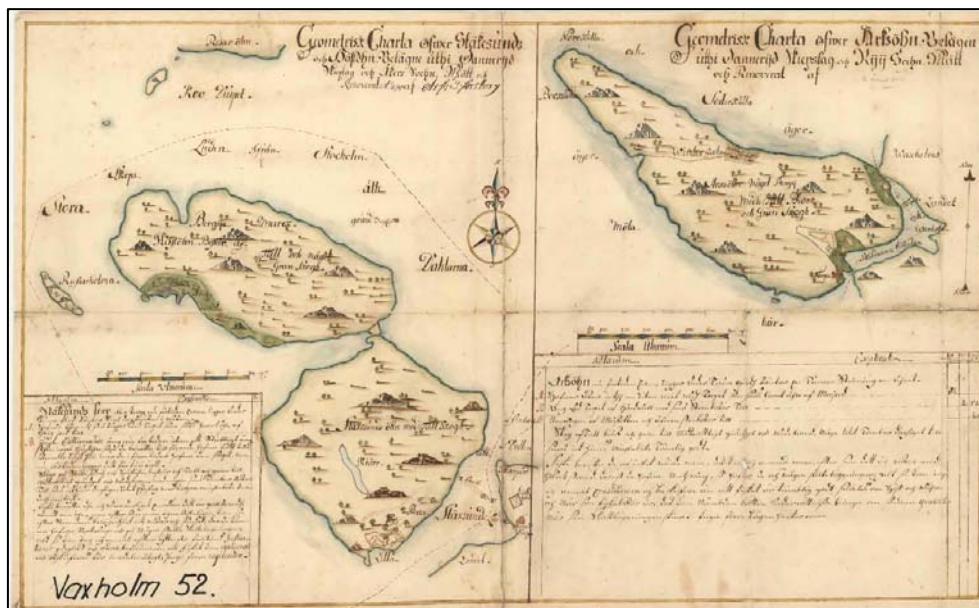
Geometrisk karta över Stegesund, okänt årtal

1702 skatteköpte kammarherre och Greve Herman Fleming Stegesund.