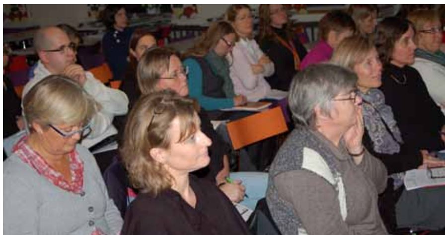
Det var främst personal från Resarö skola som var på PIM-träff den 23 januari på Söderfjärdsskolan.

– Jämfört med många andra kommuner har vi kommit igång lite sent men den stora fördelen är att vi startat i rätt ände då vi ser till att få med oss all pedagogisk personal. Det finns kommuner som börjat i andra änden genom att köpa in fina datorer utan att koppla detta till hur man använder it i det pedagogiska lärandet.