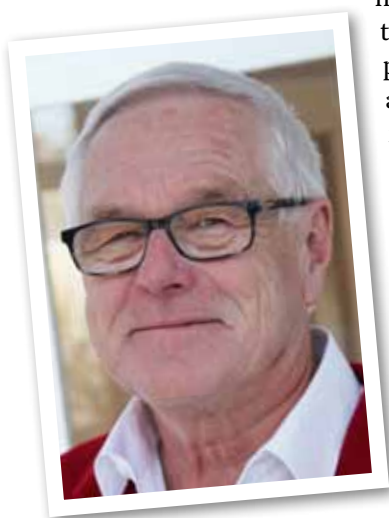
FOTNOT: Per Mosseby föräldraledig – läs mer i artikeln på s 24.