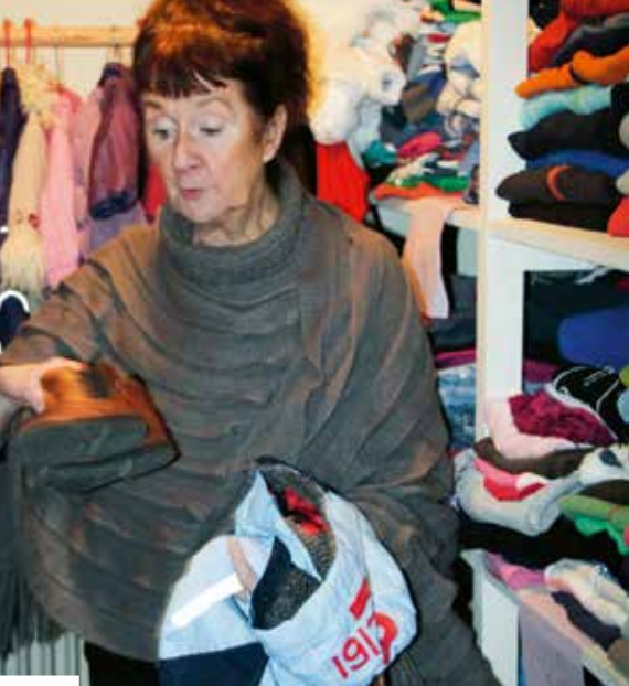
Klädförrådet är fullt med saker som skänkts av Vaxholmsborna.