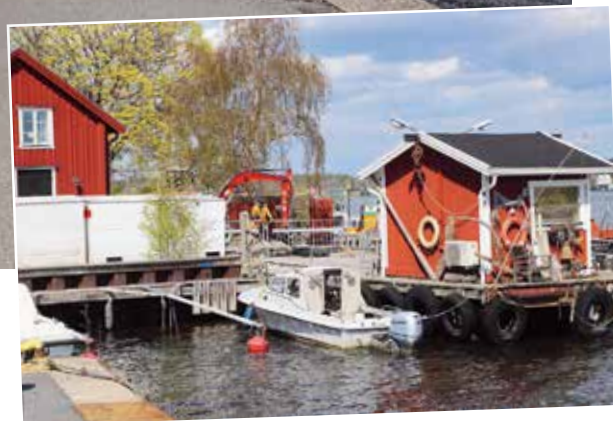
Kajen vid Cronhamnsplan.

En säkerhetszon har markerats med en gul linje längst ut på kajen, och skyltar ska tydliggöra de nya restriktionerna för lastfordon. Restriktionerna är utförda i samråd med trafikförvaltningen, som ansvarar för godstrafik till skärgården.