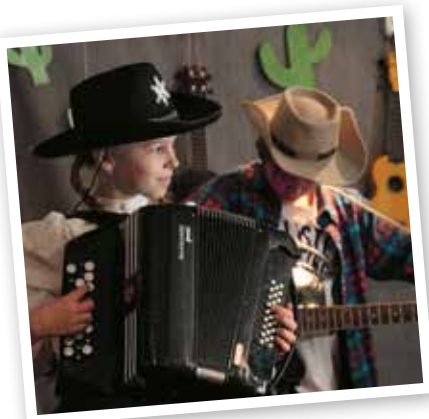
Nyligen hade Söderfjärdsskolan en show i countrys tecken.

– Att skriva musik är något jag börjat med igen under de senaste åren. Det har nu blivit ett sätt att kanalisera ut allt det jag upplevt och upplever. Allt det man kanske inte vågar prata om alltid, säger hon.