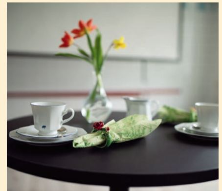
Biosalongen kan enkelt göras om till café.

En lokal som knappt användes tidigare har nu renoverats och byggts om med filmduk, projektor, en bardisk och nya svarta korgmöbler som enkelt kan ställas om till biosalong, café eller vad som för tillfället behövs. De vita kakelväggarna kommer att kläs i rött tyg för att skapa en bra ljudmiljö och ge biokänsla. I ett litet sidorum finns också en ”spa-del” där