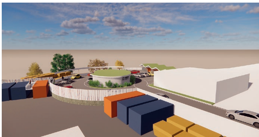
Visionsbild för den moderniserade återvinningscentralen.

Uppdaterad information om alternativ återvinningsplats och öppettider hittar du på roslagsvatten.se/ÄVC Vaxholm.