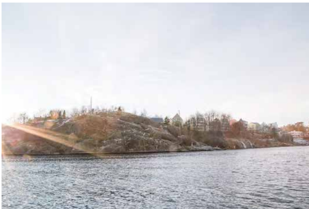
Fotomontage från planförslaget. En bebyggelsesiluet kommer att skapas mot vattnet ungefär där Norrbergsskolan ligger idag. Denna blir mer påtaglig än nuvarande bebyggelse. Påverkan i dessa delar står i direkt proportion till bebyggelsens höjd. Landskapsvärdena behålls dock i huvudsak då bebyggelsen ligger indragen från strandlinjen. Utkiksberget, till vänster i bild blir inte bebyggt.

Planförslaget tar viss hänsyn till befintlig vegetation vilket är positivt. I förslagets illustrationsmaterial har karaktärsskapande träd bevarats. Det är även önskvärt då man får en fin träridå mellan den nya och befintliga bebyggelsen längs Hamngatan för att skapa en trädgårdsstadskaraktär som kan fungera som en länk mellan befintlig och ny bebyggelse. Naturmiljön är även en viktig del i Storstugans kulturhistoriska värde som nationalromantisk byggnad. Viktigare träd och tex berghällar som skall bevaras bör därmed läggas in i detaljplanen för att ge ett ökat skydd. I PBL 8 Kap 9§ anges att naturförutsättningarna så långt möjligt tas till vara vid nybebyggelse.