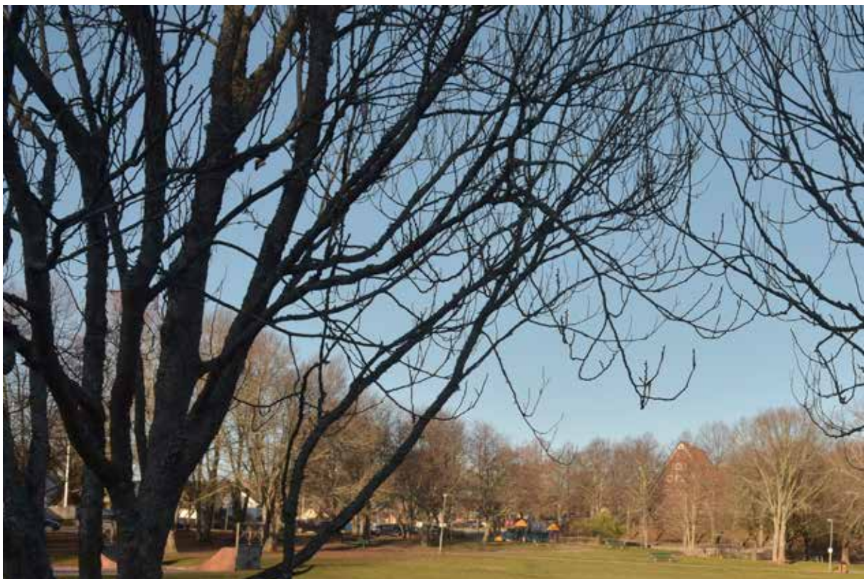
Lägret och Storstugans gavelparti. Planområdet ligger till vänster om Storstugan i bild, bebyggelsen kommer att ungefär motsvara trädkronorna i höjd. Påverkan kommer att vara begränsad och de militärhistoriska lämningarna Storstugan och lägret kommer att vara avläsbara.

Planförslaget presenterar bebyggelse som genom planbegränsningarna till största delen får en traditionell anknytning men där formspråket också representerar samtiden.