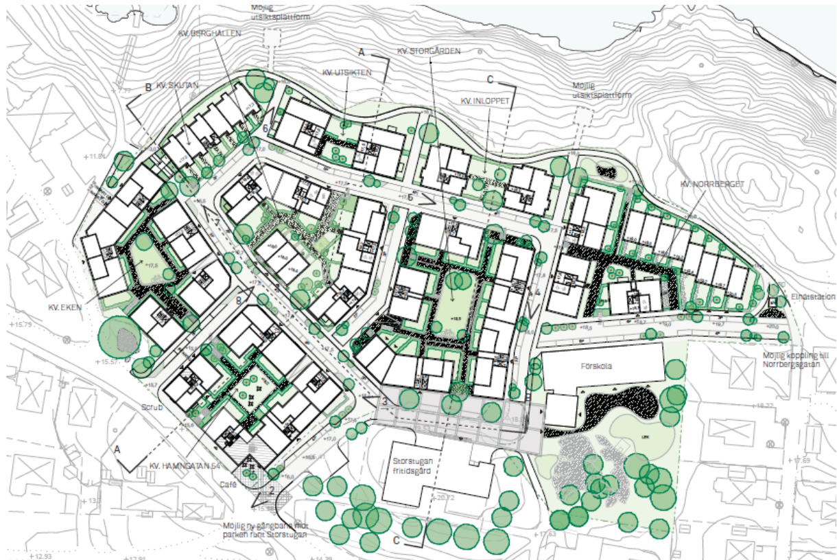
Planområdet "I Hamn" Från planförslaget