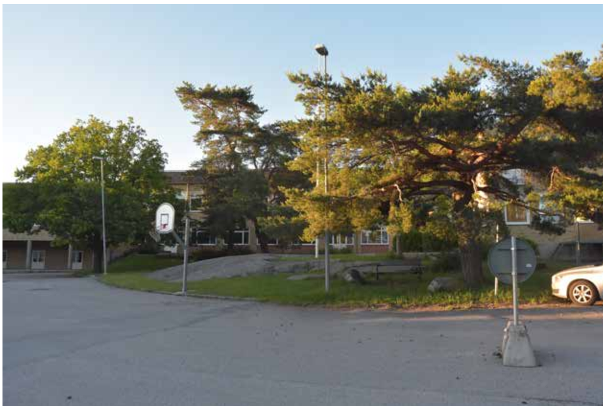
Befintliga naturvärden, idetta fall karaktärsskapande skärgårdstallar och berghöllar, bör tas tillvara och inarbetas i detaljplanen för att få rättsverkan och ett långsiktigt skydd.

Det är därmed viktigt att parallellt upprätthålla och förstärka den historiska stadskärnans identitet och attraktivitet samtidigt som man satsar på kvalitét i det nya området.